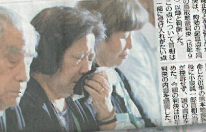
ハンセン病家族訴訟、政府が控訴断念 首相表明