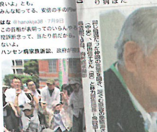
ハンセン病家族訴訟、政府が控訴断念 首相表明