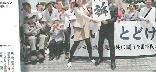
政府の控訴断念決定を受けての声明

ハンセン病家族訴訟 控訴せず。首相表明 人権侵害を考慮。ハンセン病元患者の家族の賠償を命じた熊本地裁判決を受けて、安倍首相は「国」の責任を認め、被害者への謝罪と賠償を促す。