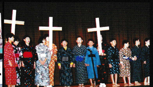
信徒発見125周年記念行事より