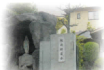
援助 修道会 黒崎修道院