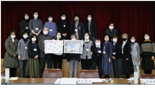
福岡地区カトリック女性の会・代表委員の面々

福岡地区女性の会は2年毎に日帰り巡礼バス旅行を実施しており、毎回100人近くの女性たちが参加します。最近では2014年にカトリック中津教会巡礼を実施しました。2016年にはカトリック八代教会巡礼が熊本地震により中止を余儀なくされました。2018年にはカトリック唐津教会巡礼が実現しましたが、