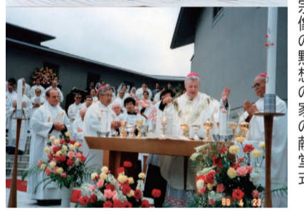
宗像の黙想の家の献堂式