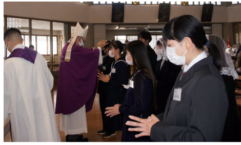
新田原教会の受堅者に握手するアベイヤ司教

11月29日(日)、ヨゼフ・アベイヤ司教は新田原教会を公式訪問した。小教区すべての信徒と語りたという意向により、司教はコロナ禍の対