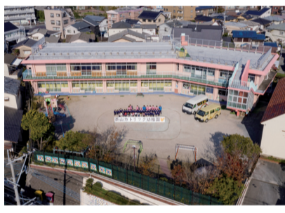
茶山カトリック幼稚園の最後の記念撮影

茶山カトリック幼稚園は、地域の方々の要望もあり初代園長である棚町神父様により昭和39年設立された小高い丘の上の教会と並ぶ幼稚園でした。いつも聖母マリア様の御