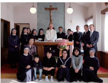
感謝ミサに参加した関係者ら

養護推進による家庭的養護が国から打ち出され、馬渡島聖母園での支援が困難となったため。100年以上の歴史があり、聖母マリア、聖霊に導かれて教会とともに生きてきた聖母園。園の職員は「深い感動とともに、島民への有難い気持ちで湧き上がってくる」と語る。聖母園を巣立って行った児