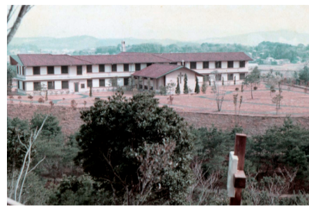
片江にあった福岡黙想の家

この度、2020年12月末日に御受難修道会福岡黙想の家を閉館することになりました。長年の教会の皆様への温かい感謝とともに、教会の皆様への期待に応えることのできなかった私たちの非力をお詫び申し上げます。