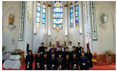
久留米教会の受堅者とアベイヤ司教

12月6日(日)、アベイヤ司教の公式訪問ミサにおいて、17人の子どものための堅信式が執り行われた。アベイヤ司教は、この日のために勉強を重ねてきた子どもたちのキラリと引き締まった良い緊張感を、優しくほぐすような笑顔で登場した。信徒に交じって入り口で検温を受け、多くの信徒との記念撮影にも気さくに応じた。