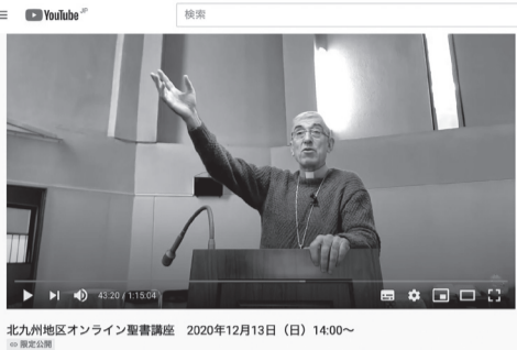
YouTube を利用したライブ配信の配信画面

12月13日(日)午後2時から、「北九州地区オンライン聖書講座」が、講師にアベイヤ司教を迎え行われた。