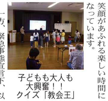
子どもも大人も大喜び！ クイズ「教会王」

テレビ番組「東大王」を真似した「教会王」クイズ大会では、問題を低学年用・高学年用・中高生用・大人用と準備し、回答者数を少なくして出題する形式を取りました。早押しクイズと得点板などの道具も購入しテレビさながらの準備をしました。感染対策後に開催しました。感染対策を考え、僅か一時間のプログラムにしていますが、毎回大人を含め30人以上が参加し、