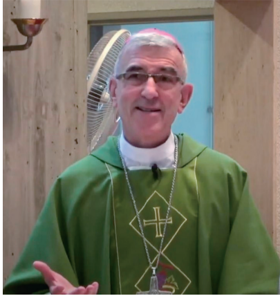
福岡教区 着座1周年を迎えたヨゼフ・アベイヤ司教

昨年5月17日の福岡教区司教着座から1年が過ぎたヨゼフ・アベイヤ司教。新型コロナウイルス感染拡大により、公開ミサや司教訪問が中止または延期になるなど、紆余曲折を経ながらも、各小教区に向いては信徒の声を傾け、交わりの場を積極的に築いてきた。