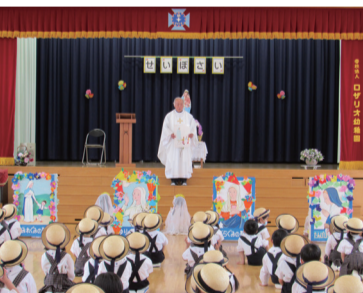
下町神父の話に耳を傾ける園児