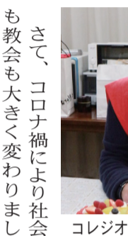
コレジオ生からの還暦祝い

さて、コロナ禍により社会も教会も大きく変わりました。ポストコロナとかウィルスとの共存などと言われていますが、かつてのように自由に誰でもミサに集うことができるようになるためにはまだまだ時間がかかるでしょう。教会が今、直面している問題は、何でしょうか。