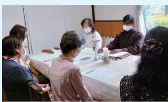
みことばに心と耳を傾けて

高宮教会では参加者が一つのテーブルを囲み、まずはゆっくり聖書を読み黙想します。その後それぞれ心に留まった聖書の中の短い言葉を選び、その言葉を黙想し、選んだ言葉とその言葉から受けた印象・感覚を、日常生活の体験と重ねて自分の言葉で発表し分かち合います。参加者からは「同じ箇所のみことばを選んで、一人ひとり経験も違えば捉え方も様々で、味わい深い分かち合いができて良い学びになります」「それぞれの体験の分かち合いから、なるほど～と思ったり、感動したり、時にはウルウルきたりと