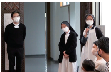
小さなお嬢さんとご両親にしっかりとらぬちゃっかり?アピール

ミサ後には、食堂で用意された弁当を、距離をとつての輪になって食べ、ここでも分かち合いに花が咲いていた。今春から福岡コレジオとともに神学院に移つたお告げのマリア修道会・福岡修道院のシスター達も紹介され、「神学生は男の子だけなので、女の子はぜひ修道女会へ」とシスター召命の呼びかけもすっかり行われた。食事の終わる頃には雨は上がり、「次は必ず」「早い時期にまた計画」と固く誓い、閉会となった。