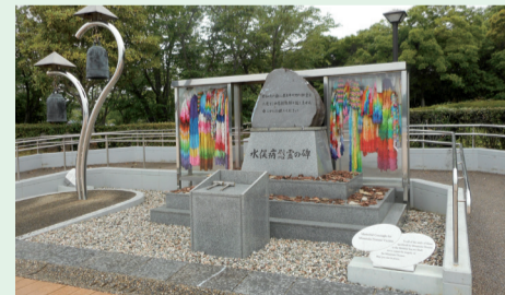
折り鶴に祈りを込めて・水俣病慰霊の碑

この言葉は、奴隷として売られ、苦難の道歩んだ聖パキータ(スーダン生まれ、1947年2月8日帰天。カノッサ修道女会修道女。2000年10月1日列聖。自身奴隷として売られた経験をもつ)が、「奴隷商人を赦す」と言った「赦す」と重なった。栄子さんの言葉を大切に、今なお続く課題からの回復を神に祈る。