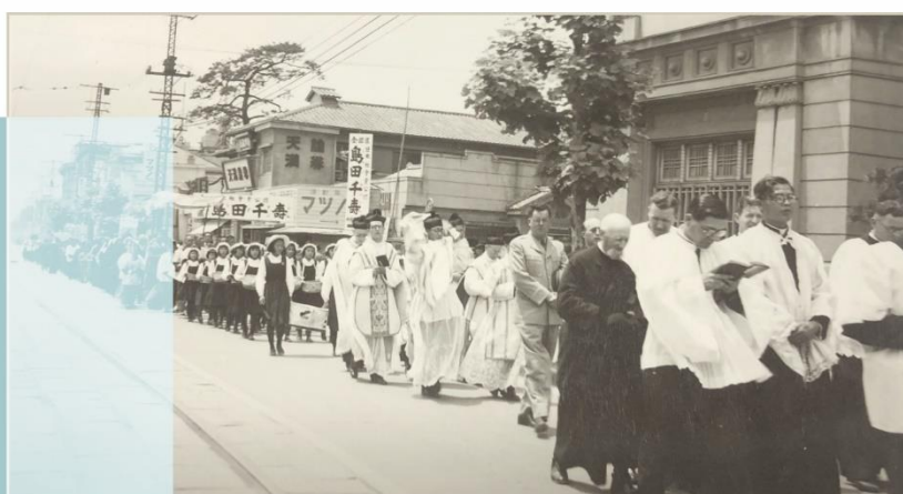
1950 procesión eucarística en Fukuoka

La diócesis de Fukuoka acogió las orientaciones del Concilio y comenzó a implementar la reforma litúrgica y promovió el establecimiento y desarrollo del apostolado de los laicos a través de la constitución del Consejo del apostolado seglar y sus actividades. Las actividades juveniles se incrementaron en toda la Diócesis, y se organizaron con frecuencia seminarios, retiros y sesiones de formación.