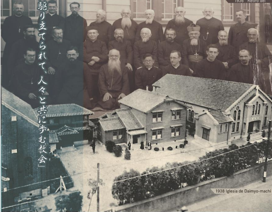
1936 Retiro del