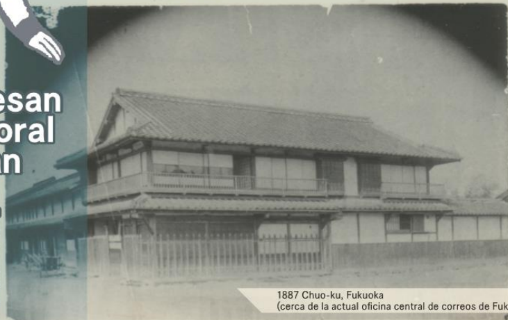
1887 Chuo-ku, Fukuoka (cerca de la actual oficina central de correos de Fukuoka)