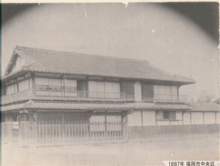
1887年 福岡市中央区 (現中央郵便局付近) 民家にて宣教開始