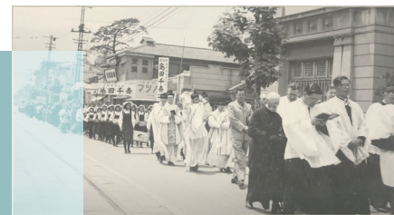
1950年 福岡の町中を進む聖体行列

第二バチカン公会議の結果を受けて、福岡教区でも典礼(ミサ)の改革を始め、特に信徒使徒職協議会の設置や発展により、信徒の活動がより活発になりました。各地区での青少年活動も盛んになり、研修会や黙想会、錬成会が頻繁に開かれるようになりました。