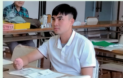
ティ神学生の日本語授業の様子

Ngày trở lại Giáo xứ Hikarigaoka vào sáng Chúa Nhật, nên có dịp tham dự thánh lễ, gặp gỡ, trò chuyện cùng anh chị em giáo dân. Cuộc gặp gỡ buổi sáng thật vui.