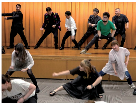
カタルン開設の懇親会でソーラン節を披露する福岡教区の青年たち

「世界青年の日」は、1984年、贖いの聖年の開幕ミサで聖ヨハネ・パウロ2世教皇が、世界の青年たちに、翌85年の受難の主日にローマに集まるようにと呼びかけ、世界の約60カ国、30万の青年が、教皇の呼びかけに呼ばれてローマに集まったことに始まり、翌86年から受難の主日に祝うように定められた。以来、毎年この日に、世界の青年たちに向けて「教皇メッセージ」が送られている。※教皇フランシスコは各方面からの要望にこたえ、2021年から「王であるキリスト」の祭日に変更することを発表した。