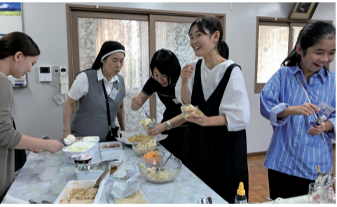
思い思いにアイスを楽しめる楽しいパーティー

この集いを通して、一人ひとりが自分に与えられた賜物があることを知った。それが何かまだわからないかもしれないが、自分に与えられた賜物を発見することは、神様をもっと知り、「神様が私を用いよう」と望んでおられることにも気づくことができる一歩となった。