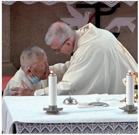
アベイヤ司教(右)とミサの中で「主の平和」を交わす共同司式の山頭神父(左)

厚生労働省が、9月15日時点における年齢を基礎として、100歳以上の数を計上した2024年の結果は、全体で95,119人。男性11,161人、女性83,958人で約88%が女性であった。「人生100年時代」と言われ始めて久しいが、内12%の男性の中に、我が福岡教